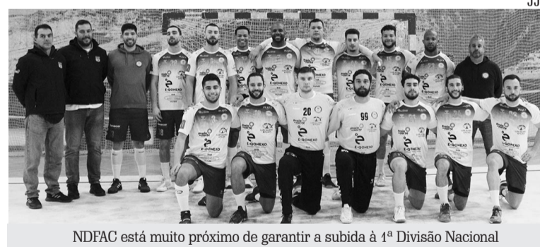
NDFAC está muito próximo de garantir a subida à 1ª Divisão Nacional