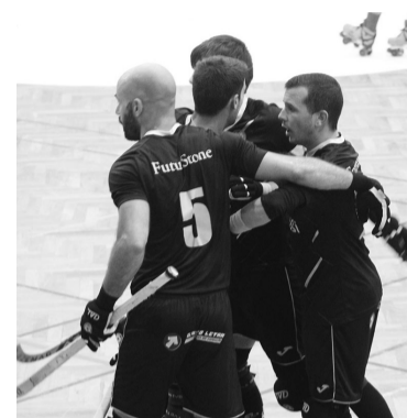
AACD está a uma vitória de subir à 2ª Divisão Nacional