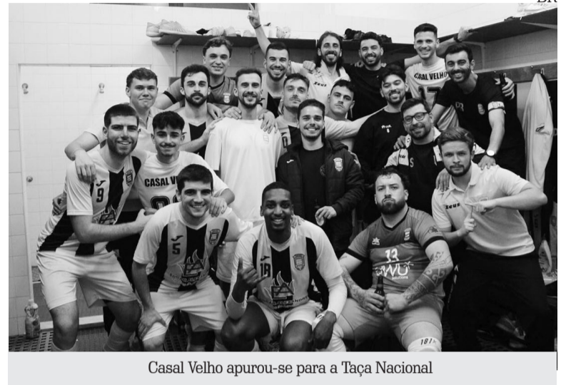
Casal Velho apurou-se para a Taça Nacional