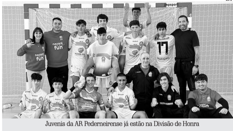
Juvenis da AR Pederneirense já estão na Divisão de Honra