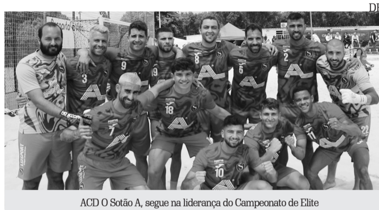
ACD O Sotão A, segue na liderança do Campeonato de Elite

Jogou-se no passado dia 12 de Maio na Arena Manuel Ferreira em Chelas (Lisboa), a 3ª jornada do Campeonato Nacional, Zona Sul, na qual a ACD "O