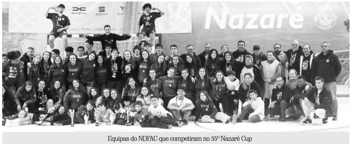
Equipas do NDFAC que competiram no 35º Nazaré Cup