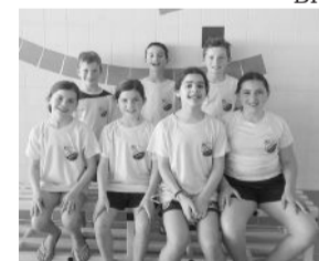
Nadadores do BSCN que competiram no Torregri