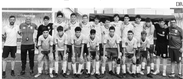
Juvenis do SU Alfeizerense lideram o Grupo B, Série C na 1ª Distrital