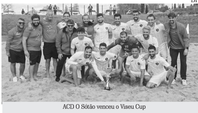
ACD O Sótão venceu o Viseu Cup