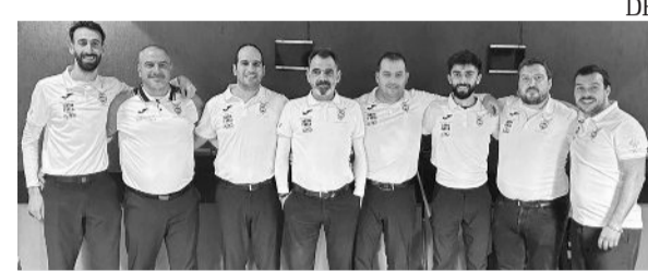
GD Os Nazarenos Cubata Bar sagram-se de novo Campeões Distritais de Pool Português

No que diz respeito à Taça de Portugal de Pool Português, série 7, em jogo da 3ª eliminatória o GDN/CB conseguiu a proeza de vencer a União de Leiria - Pool Club, (2-9), passando desta forma para a Fase Final desta competição. Para a 2ª eliminatória o GDN/CB eliminou o GDN/LBP no dérbi nazareno, (9-7). Na 1ª eliminatória, o GDN/CB eliminou a ACR Maceirinha ACIMENTADOS DAVID'S, (9-8); o GDN/LBP venceu a União de Leiria - TVN, (9-5). Para a 2ª eliminatória o GDN/CB eliminou o GDN/LBP no dérbi nazareno, (9-7). Na 1ª eliminatória, o GDN/CB eliminou a ACR Maceirinha ACIMENTADOS DAVID'S, (9-8); o GDN/LBP venceu a União de Leiria - TVN, (9-5). ■