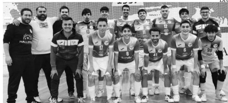
Burinhosa B está no 3º lugar na 1ª Distrital Série A